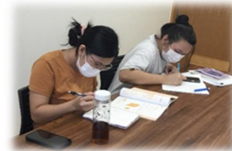
日本語を勉強する二人↑